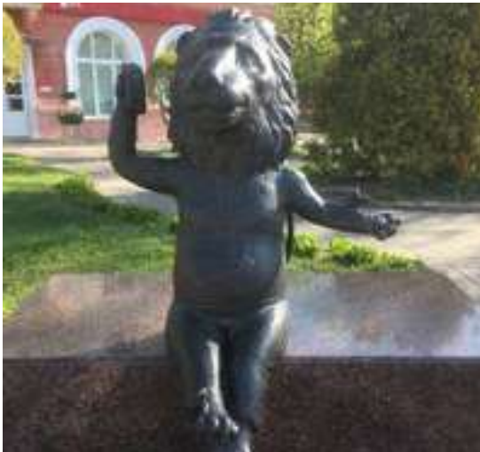
Лева из Могилева

Еще один необычный памятник, установленный недавно - Лева из Могилева. Скульптура - символ гармонии природы и цивилизации. В левой руке Лева держит мобильный телефон и носит майку с изображением герба родного города.