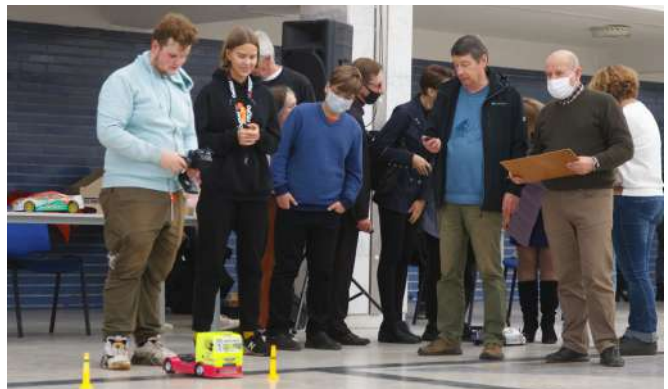
Предстартовые испытания ...

Пришедшие на турнир журналисты сразу почувствовали «бурление» моторов в сердцах их создателей – юных техников из разных уголков столицы. Пока машинки в боксах отдыхали перед стартом, их обеспокоенные и сосредоточенные хозяева делали последнюю проверку готовности, о чем-то беседуя между собой. Но голос, объявивший начало состязаний, в момент «разбудил» автомобили и подал знак участникам, что назад дороги нет. Правда, их это нисколько не смутило.