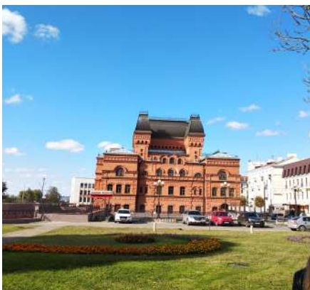
Могилевский драматический театр