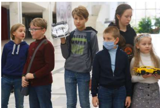
В томительном ожидании...

На протяжении всего турнира юные журналисты видели только радостные, заинтересованные, обеспокоенные, порой даже плачущие лица – все говорило о том, что в этом занимательном техническом «мире» радиоуправления кипела жизнь. У каждого была одна цель: показать себя с лучшей стороны.